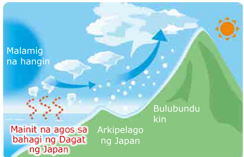
Mekanismo na gumagawa ng maraming snow

Kaugnay na impormasyon : NHK WORLD-JAPAN [Mga balita sa wikang banyaga at impormasyon sa pag-iwas sa sakuna]