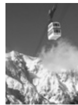
①新穂高 ロープ ウェイ (岐阜県)

愛知県：江戸幕府を開いた徳川家ゆかりの地であり、自動車産業以外にも、農産物や瀬戸市、常滑市の陶器でも有名です。金の鯨で知られる名古屋城、徳川園や三種の神器のひとつ草薙神剣を祀る熱田神宮で歴史を感じ、トヨタ博物館やノリタケの森で地元産業に触れることができます。渥美半島の伊良湖岬灯台から恋路ヶ浜までの白浜、香嵐溪の香積寺や鳳来寺の自然も見所です。タイから寄贈された仏舎利を安置している日泰寺もあります。