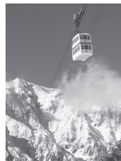
①新穂高 ロープウェイ (岐阜県)

愛知県：江戸幕府を開いた徳川家ゆかりの地であり、自動車産業以外にも、農産物や瀬戸市、常滑市の陶器でも有名です。金で知られる名古屋城、徳川園や三種の神器のひとつ草薙神剣を祀る熱田神宮で歴史を感じ、トヨタ博物館やノリタケの森で地元産業に触れることができます。渥美半島の伊良湖岬灯台から恋路ヶ浜までの白浜、香嵐溪の香積寺や鳳来寺の自然も見所です。タイから寄贈された仏舎利を安置している日泰寺もあります。